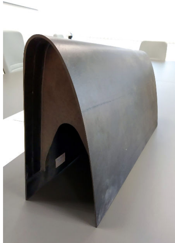
La pièce composite finale d'une aile d'avion courbe, produite avec la technologie FDM.

« Grâce à l'utilisation de la résine ULTEM™ 1010, nous avons obtenu un outil de préforme aux propriétés mécaniques parfaites qui nous a permis de déployer cette étape innovante du processus RTM. Nous avons ainsi réduit l'étape de chauffage composite d'une heure à dix minutes seulement, en faisant passer le courant électrique directement dans les couches composites », poursuit-il. « Ceci n'aurait pas été possible sans la fabrication additive FDM ».